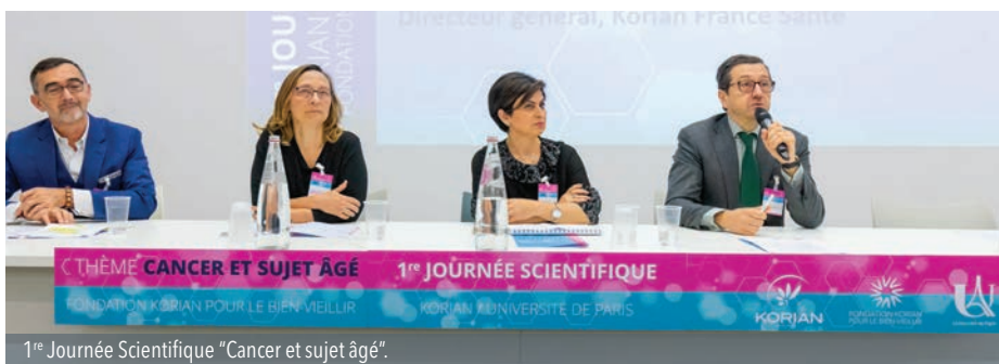
1 re Journée Scientifique "Cancer et sujet âgé".