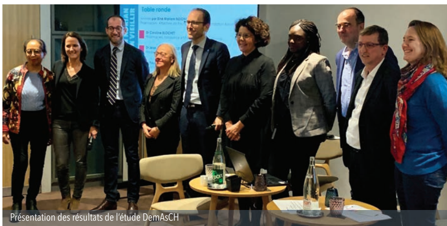
Présentation des résultats de l'étude DemAsCH

La Fondation Korian a démarré 2020 avec une triple actualité.