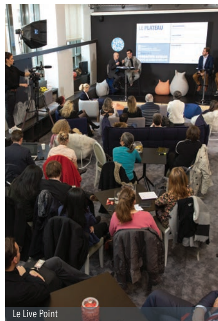
Le Live Point