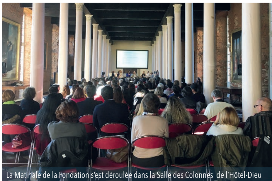
La Matinale de la Fondation s'est déroulée dans la Salle des Colonnes de l'Hôtel-Dieu

Nous resterons sur ces paroles d'une grande force. Je conserverai la notion de « rester avec » plutôt que de « se mettre à la place ». Le don est finalement ce qui donne un sens à la vie.