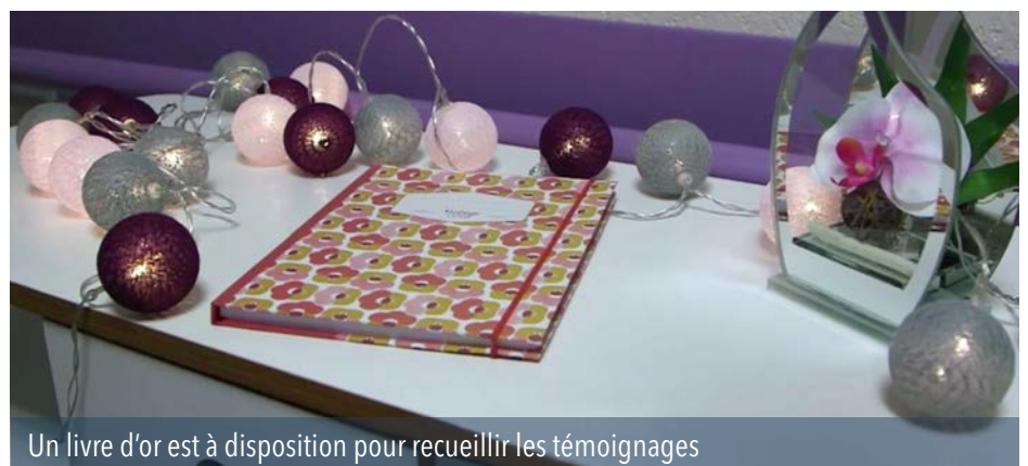
Un livre d'or est à disposition pour recueillir les témoignages

L'accompagnement de la vie jusqu'à la fin peut être mené par différentes personnes et associations de bénévoles, formés à l'accompagnement des personnes malades comme des familles.