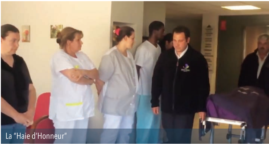
La "Haie d'Honneur"

Nous soutenons le projet de clown d'accompagnement de la Compagnie du Bout du Nez à l'unité de soins palliatifs de Toulouse. Nous avons également initié une étude exploratoire intitulée « Soins palliatifs, handicap et polyhandicap ». Cette étude a fait remonter plusieurs dispositifs intéressants dont celui du Sésame relationnel développé par la MAS TI-Loar en Bretagne.