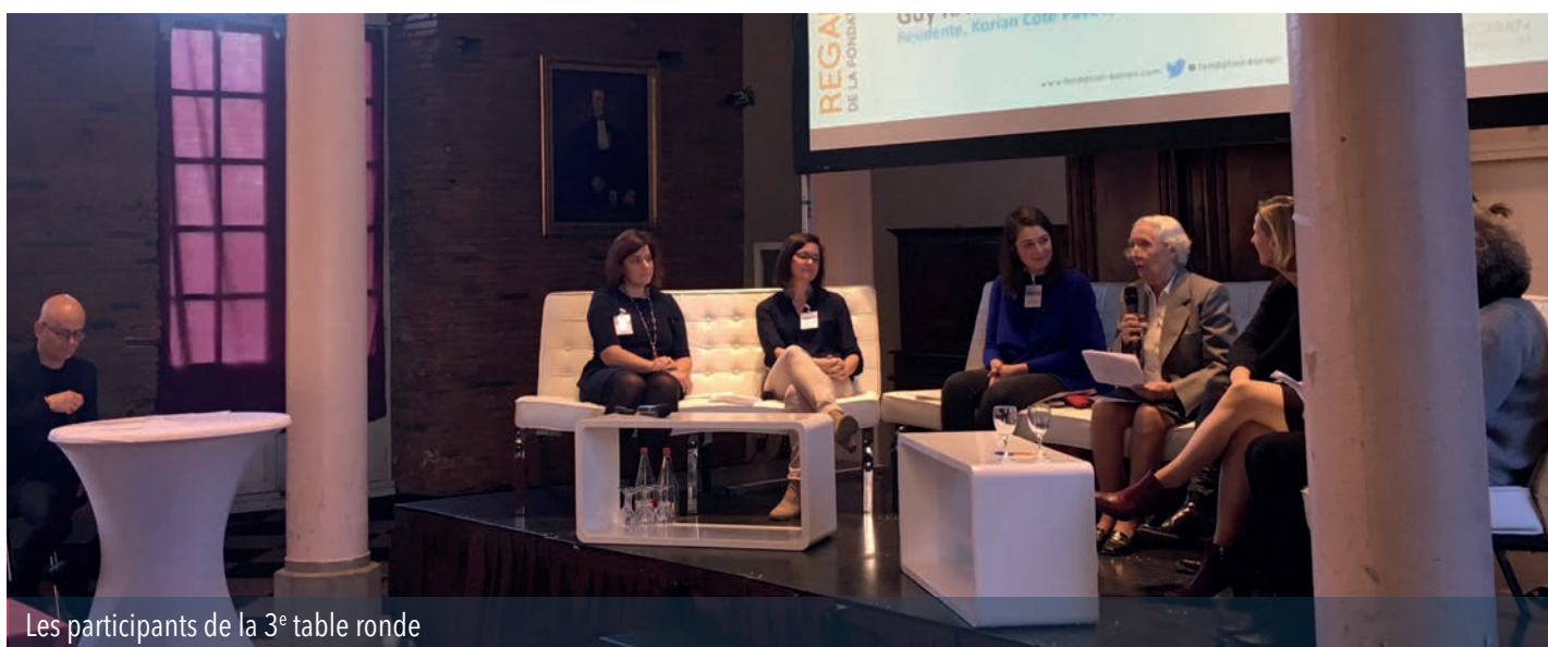
Les participants de la 3 e table ronde